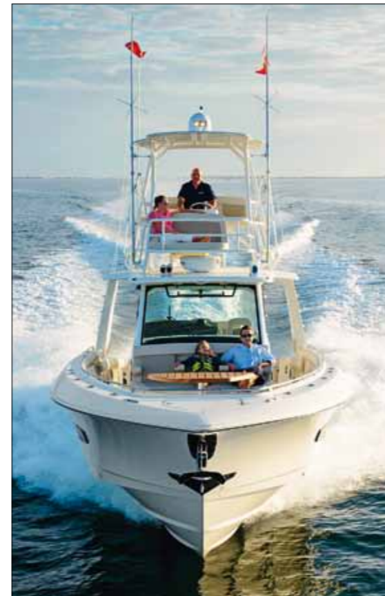
Lancée à pleine allure, la carène fait preuve d'une épatante capacité à absorber le clapot.

Fier de son passé et confiant en l'avenir. Tel est le credo du côté d'Edgewater, sur la côte ouest floridienne, au siège de Boston Whaler. Construisant pas moins de 2000 bateaux par an, la marque mythique surfe sur l'engouement que rencontrent actuellement les grands opens aux États-Unis, mais aussi à travers le monde puisque plus de 25 % de sa production part à l'export. Environ 500 personnes s'activent sur le principal site de production du constructeur, qui vient d'être agrandi afin d'être en mesure de répondre à la demande. Boston Whaler dispose également d'une seconde usine, située à cinq milles du centre d'Edgewater, où sont construits l'ensemble de ses bateaux destinés à l'administration.