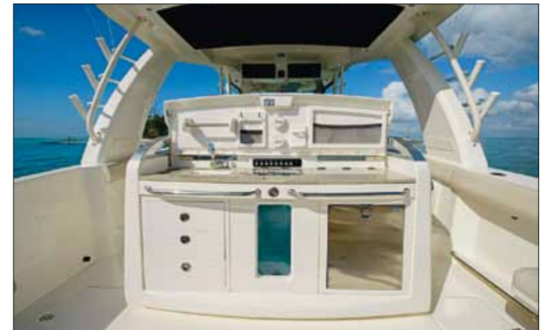
Offrant trois places assises en position fermée, le leaning-post dissimule une cuisine d'été complète, où cohabitent réfrigérateur, évier et grill.

la partie supérieure de l'open accueille également une confortable méridienne pour deux personnes, une grande première pour le constructeur américain. Notez toutefois qu'accéder à ces installations nécessite de réaliser quelques acrobaties à bord de cette coque numéro un. Ses concepteurs ont cependant promis des améliorations sur les prochains modèles. On vous l'a dit, en dépit de sa taille, ce bateau conserve tous les